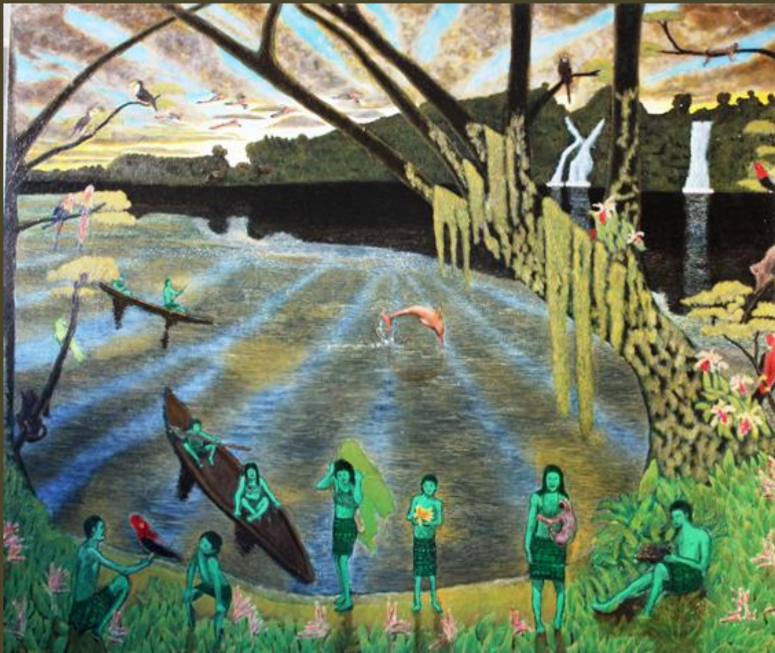
Olio su tela 100 x120