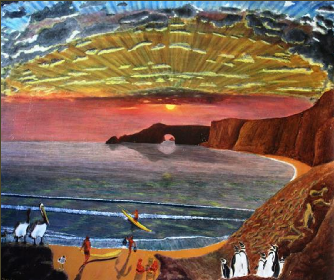
Olio su tela 100 x120