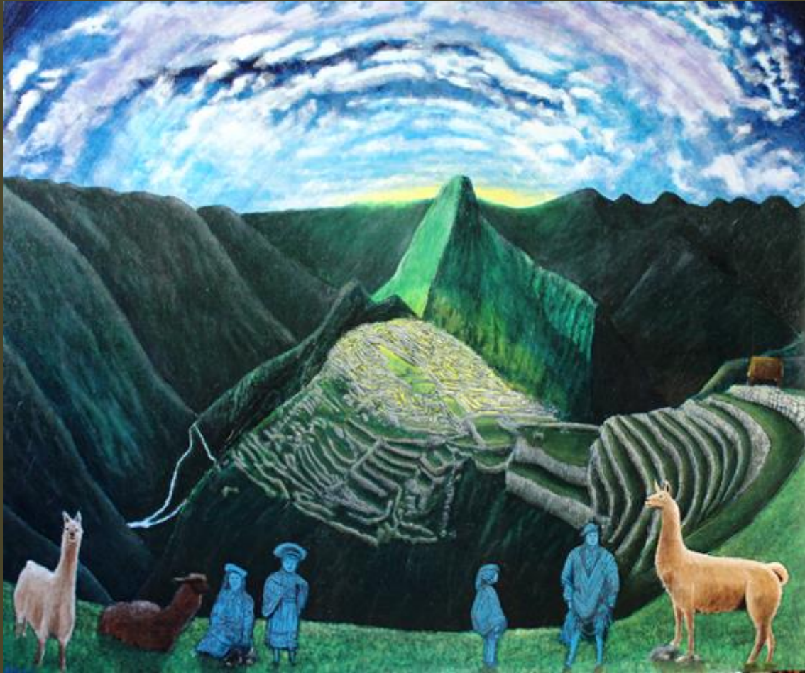
Olio su tela 100 x120