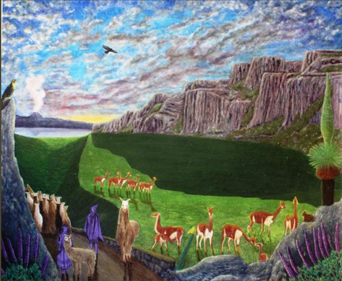
Olio su tela 100 x120