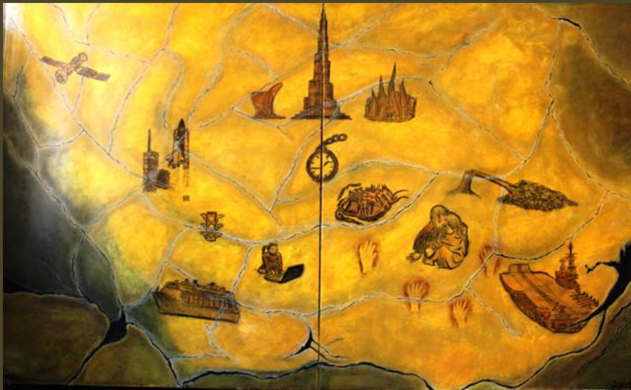
Olio su tela 120 x 200